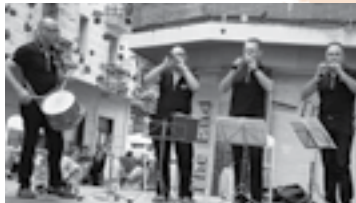
TOCATS DE CANYA, grup creat al Vendrell el 1998