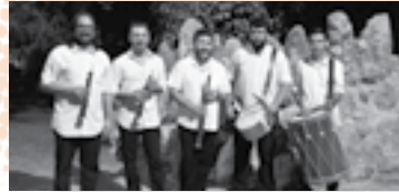
ELS AIXARTS, grup creat al Vendrell el 2012