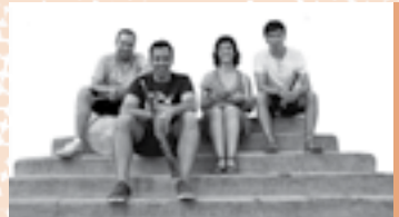
ELS VINARDELLS, grallers del Penedès

Grup que neix l'any 2004 amb l'objectiu de formar un grup estable de tres gralles i timbal i interpretar tant el repertori més tradicional per a aquesta formació com el més contemporani i de nova creació, amb un èmfasi especial en la pulcritud i el resultat sonor, intentant no posar sostre a la seva millora. Tots els membres han rebut formació a l'Escola Municipal de Música Tradicional del Penedès, a l'Aula de Sons de Reus, a l'Aula de Música Tradicional i Popular, el Conservatori del Liceu i l'Escola Superior de Música de Catalunya. El 2013 van editar el disc Els Vinardells fan Festa Major! , amb les músiques de la Festa Major de Vilafranca i el 2015 han estrenat l'espectacle Separar el gra de la gralla .