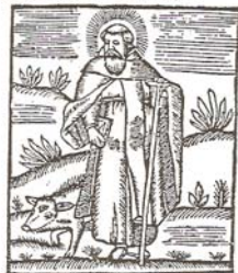
S. ANTONI I V.

La gent del poble entesa en núvols encara aplica el nom de barqueta de Sant Antoni a uns núvols llargs que solen sortir cap a la posta, perquè, segons la tradició barcelonina, recorden el núvol que el sant féu servir de barca per a venir de la Tebaida fins a Barcelona. El sant va visitar la filla del governador, la va beneir, i a l'instant la va guarir. Quan tot just havia entrat a la ciutat, se li va presentar una truja que portava un garrinet a la boca que no podia caminar perquè era trípode. La truja va deixar el garrinet als peus del sant, aquest el va beneir i a l'instant es va posar a córrer amb la quarta pota que li va créixer miraculosament. La truja, agraïda al sant, no va deixar-lo mai per res i va seguir-lo sempre per tot arreu. El porquet que caracteritza la iconografia de Sant Antoni i que mai no deixa de figurar al seu costat, és, per tant, barceloní i no és tal porquet, sinó una truja.